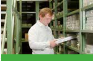
Fachkraft für Lagerlogistik